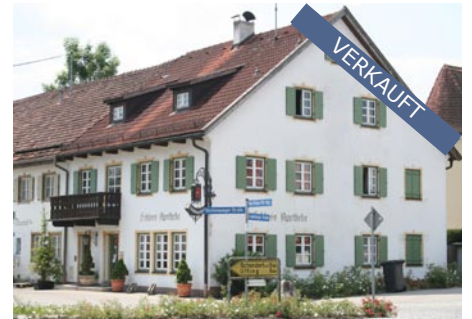
Bachern am Wörthsee