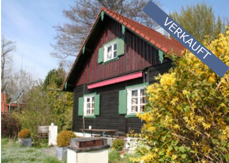
Schondorf am Ammersee