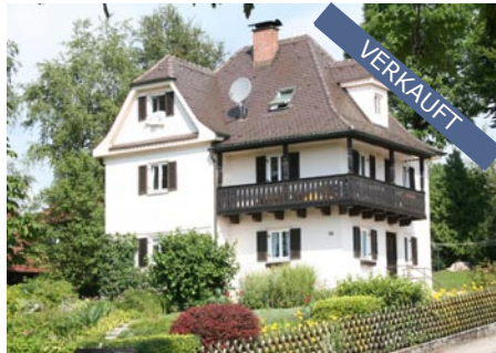
Windach - Ammerseeregion